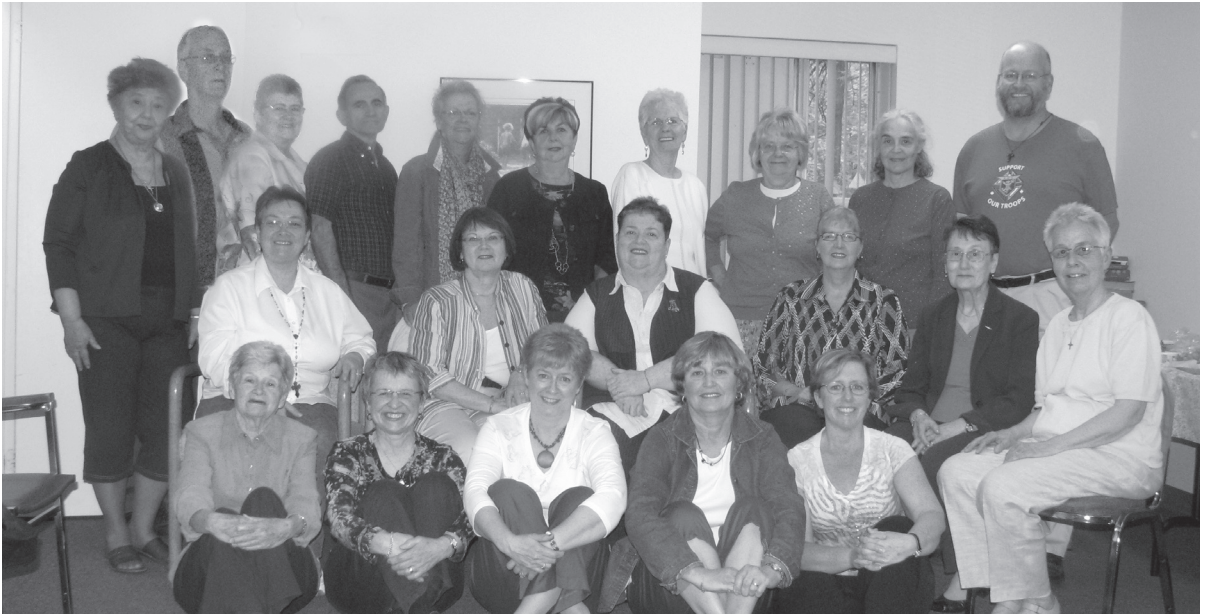
Le personnel du Centre et un groupe de bénévoles